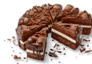
UNSERE PRACHTSTÜCKE Chocolate Thunder Torte Art.-Nr. 39001059 VE: Vorgeschritten in 12 Port., 2,2kg Preis: 27,70 €