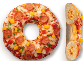
Pizza-Donut Diavolo, vorgebacken Art.-Nr. 34002633, VE: 40 Stück à 100 g, 4 kg Preis: 60,00 €