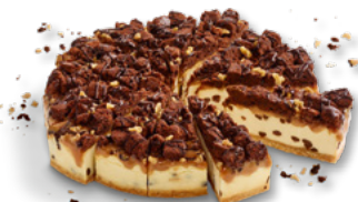
ERLENBACHER Caramel Brownie Cheesecake Art.-Nr. 39000877 VE: Vorgeschritten in 14 Port., 1,95kg Preis: 26,20 €