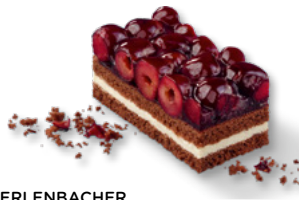
ERLENBACHER Sauerkirschen-Schoko-Sahne-Schnitte* Art.-Nr. 39000832 VE: Vorgeschritten in 12 Port., 1,35kg Preis: 24,20 €