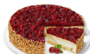
ERLENBACHER Himbeer-Käse-Sahne-Torte Art.-Nr. 39000778 VE: Ungeschritten, 2,2kg Preis: 26,60 €