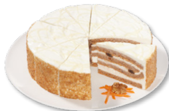
UNSERE PRACHTSTÜCKE Rübli-Torte, 4-Schichten Art.-Nr. 39000810 VE: Vorgeschritten in 12 Port., 2,0kg Preis: 27,70 €