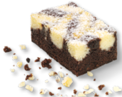
ERLENBACHER Schoko-Kokos-Schnitte Art.-Nr. 39001008 VE: Vorgeschritten in 20 Port., 2,4kg Preis: 30,75 €