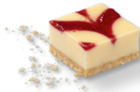
ERLENBACHER Himbeer-Cheesecake-Schnitte Art.-Nr. 39000805 VE: Vorgeschritten in 48 Port., 2,35kg Preis: 29,90 €