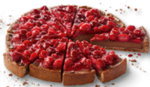
ERLENBACHER BARISTA CAKES Chocolate Raspberry Cake Art.-Nr. 39000690 VE: Vorgeschritten in 12 Port., 1,2kg Preis: 17,25 €