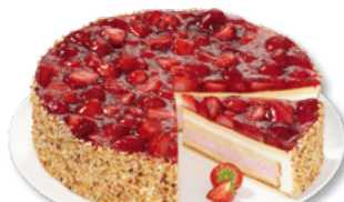
ERLENBACHER Erdbeer-Buttermilch-Torte Art.-Nr. 39000874 VE: Ungeschritten, 2,25kg Preis: 32,80 €