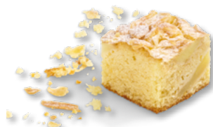
ERLENBACHER Großmutter's Apfel-Schnitte Art.-Nr. 39000806 VE: Vorgeschritten in 48 Port., 1,8kg Preis: 26,30 €