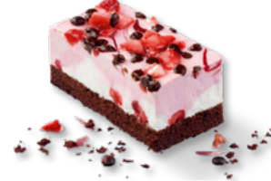
ERLENBACHER Erdbeer-Schnitte vegan Art.-Nr. 39000774 VE: Vorgeschritten in 12 Port., 1,55kg Preis: 24,20 €