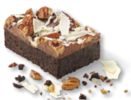
ERLENBACHER Pecan-Brownie Art.-Nr. 39000986 VE: Vorgeschritten in 16 Port., 1,0kg Preis: 17,50 €