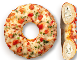
Pizza-Donut Tomate-Basilikum, vorgebacken Art.-Nr. 34002632, VE: 40 Stück à 100 g, 4 kg Preis: 60,00 €