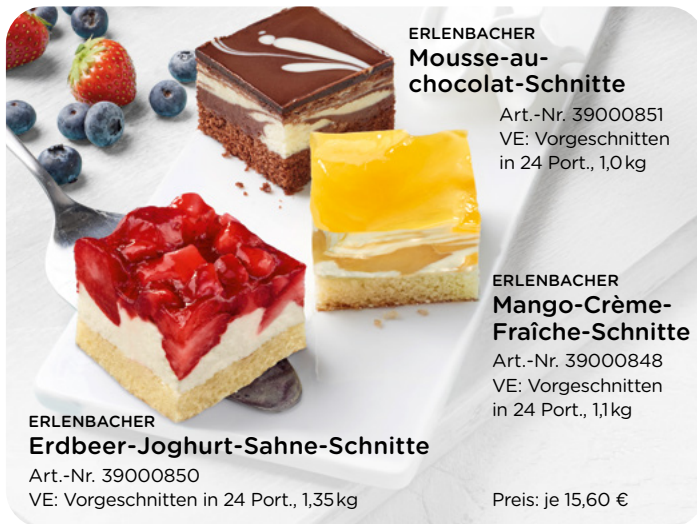
ERLENBACHER Mousse-au-chocolat-Schnitte Art.-Nr. 39000851 VE: Vorgeschritten in 24 Port., 1,0kg