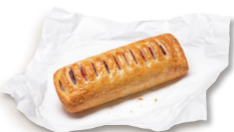
Kirschtasche, vorgegärt Art.-Nr. 34002634, VE: 64 Stück à 120 g, 7,68 kg Preis: 81,30 €