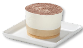
ERLENBACHER Latte-Macchiato-Törtchen Art.-Nr. 39000917 VE: 12 Stück, 0,66kg Preis: 17,95 €